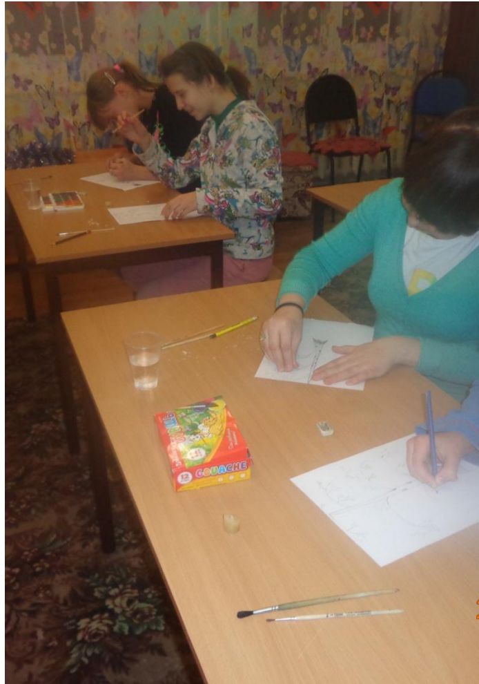
Рисование березы карандашом.