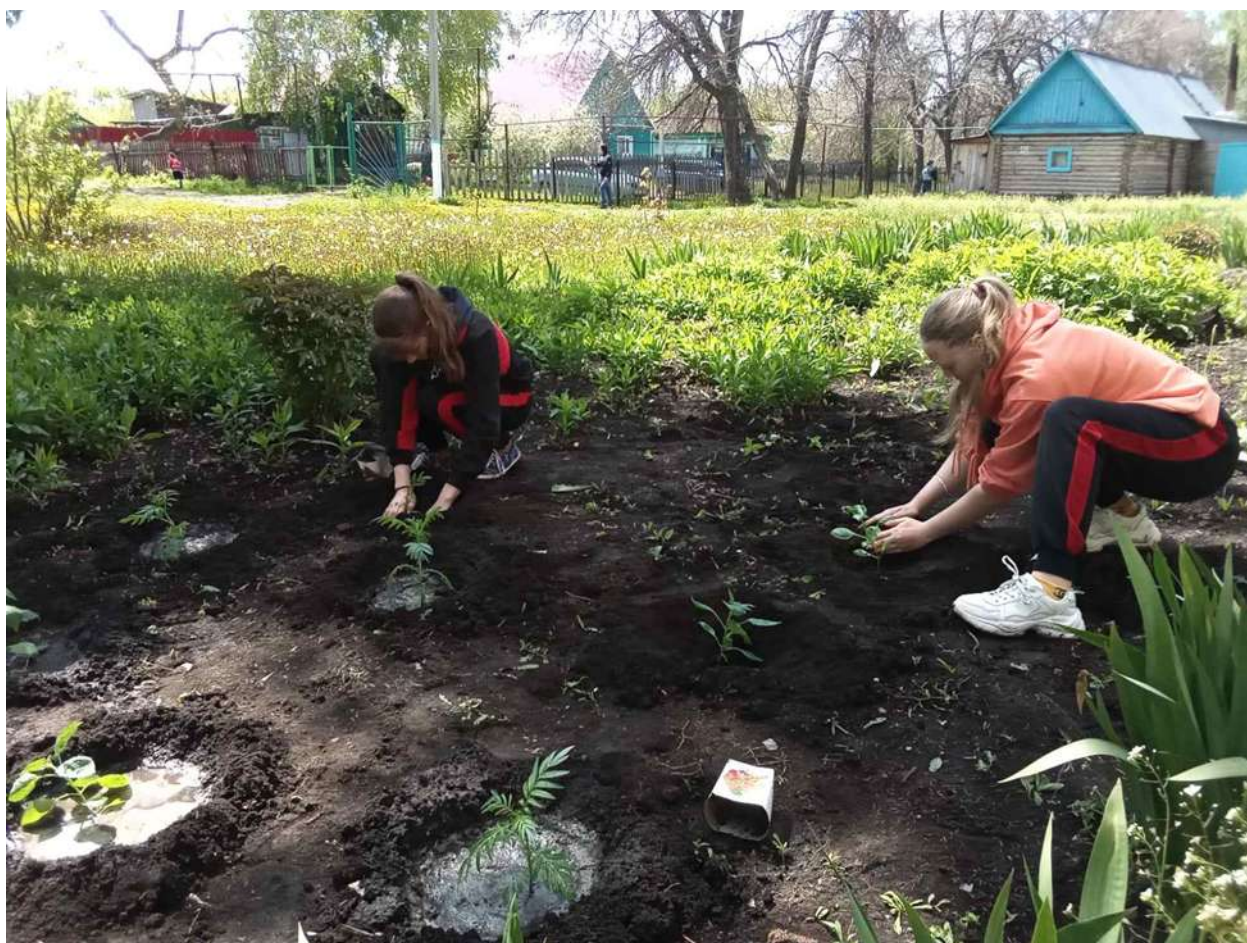
Обучающиеся ГБОУ школы-интерната убирали территорию памятника, высадили цветы, кустарники.