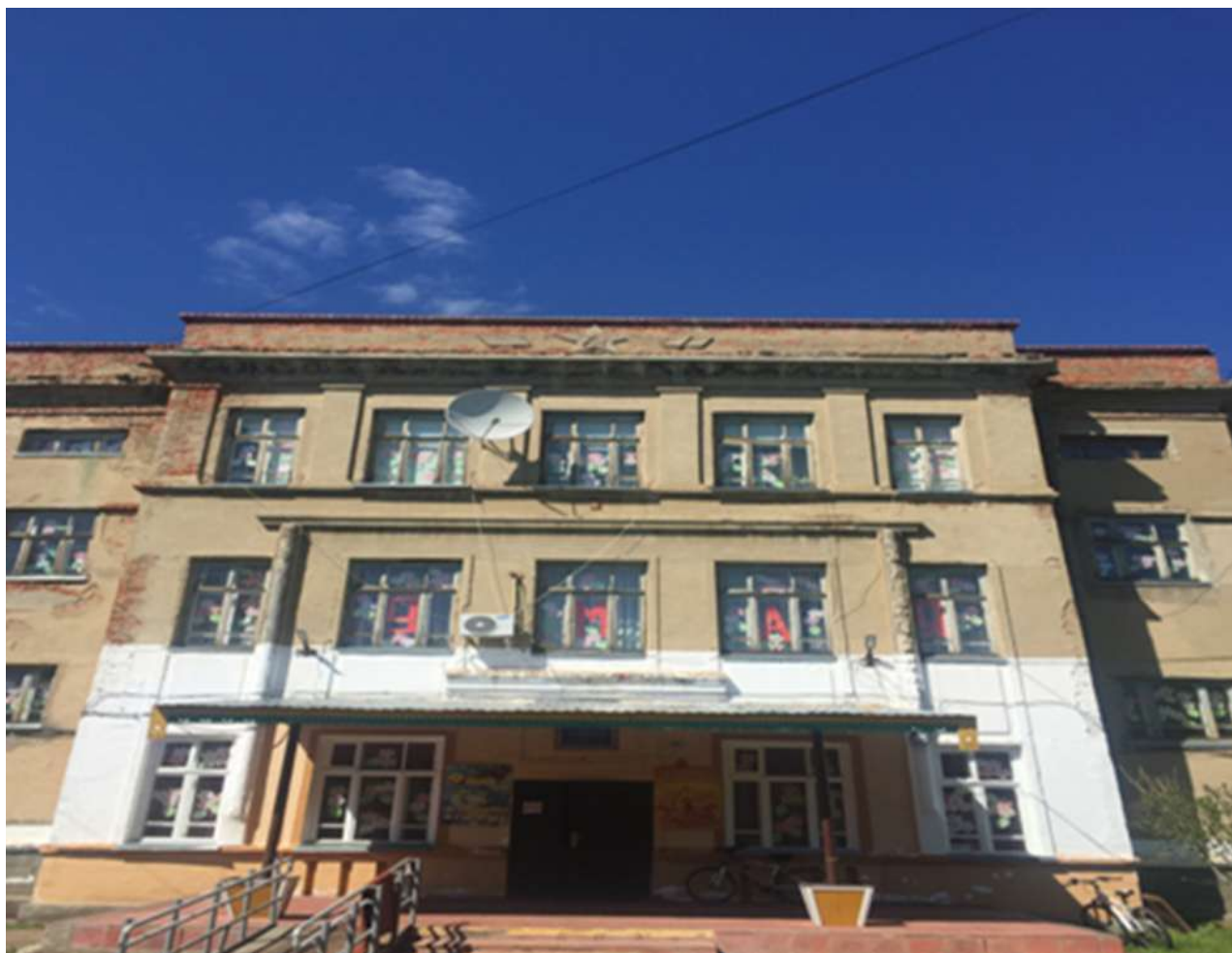
Оформлен стенд ко Дню победы.