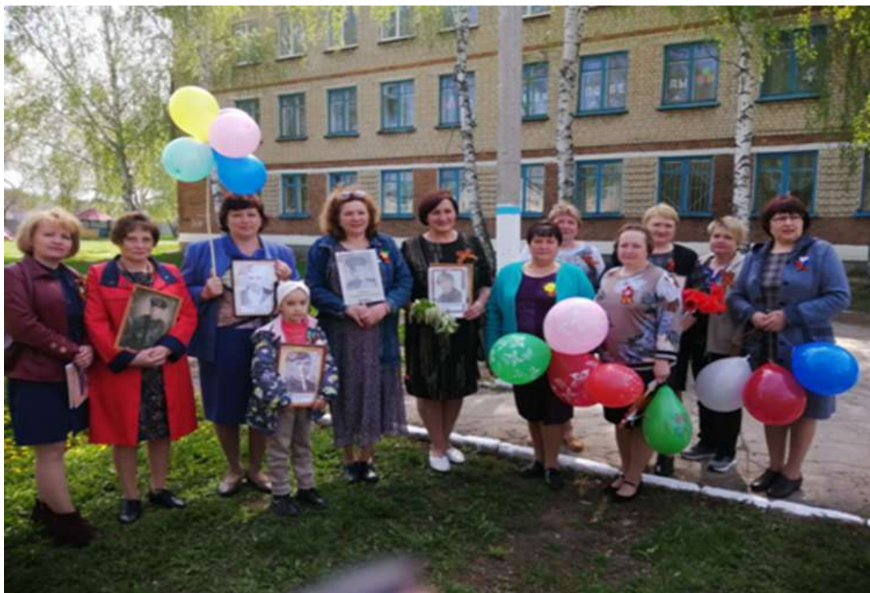
Народное шествие «бессмертный полк» .

Ежегодно учащиеся и педагоги школы принимают участие на Митинге, посвящённый Дню победы, возложение венков и цветов к обелиску воинам, павшим в годы Великой Отечественной войны, а также на праздничном концерте к 9 мая,